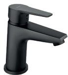
Bateria umywalkowa stojąca czarny