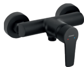
Bateria natryskowa ścienna czarny