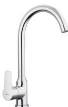
Bateria kuchenna stojąca chrom