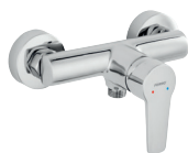
Bateria natryskowa ścienna chrom