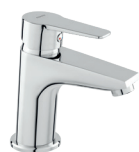
Bateria umywalkowa stojąca chrom