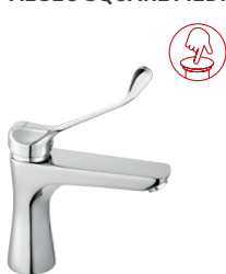
Bateria umywalkowa stojąca