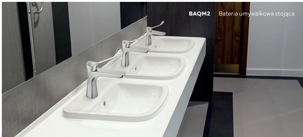
BAQM2 Bateria umywalkowa stojąca