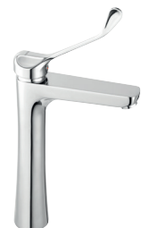
Bateria umywalkowa stojąca nablutowa chrom