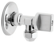
zawory z podłączeniem do rury miedzianej Ø10 mm