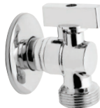
zawory dedykowane do pralki lub zmywarki – z wbudowanym zaworem zwrotnym