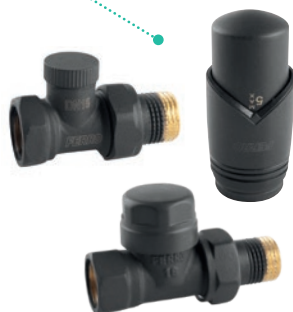
ZESTAW TERMOSTATYCZNY PROSTY