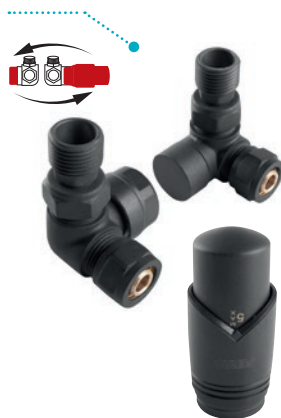
ZESTAW TERMOSTATYCZNY OSIOWY