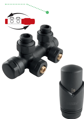
ZESTAW TERMOSTATYCZNY ZESPOLONY